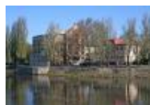
Podskalský mlýn přes Labe