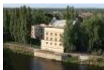
Podskalský mlýn z centra města, v pozadí