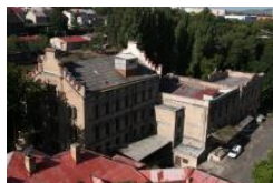
Podskalský mlýn z Práchovný (2007)