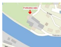
Vyznačený Podskalský Mlýn